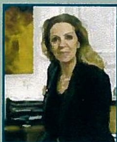
ARE Michèle Sabban élue présidente de l'Assemblée des Régions d'Europe

Les Régions appellent le gouvernement à plus de concertation