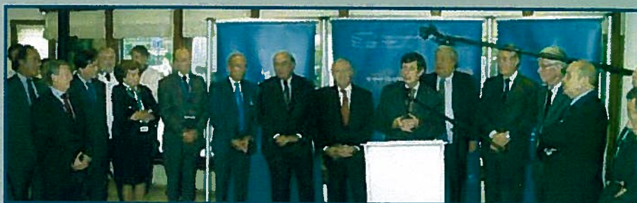
Open Days 2008 La délégation française du Comité des Régions mobilisée sur la question de la cohésion territoriale