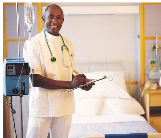
Immer mehr Europäer überqueren das Mittelmeer, um sich behandeln zu lassen.

Was das Bildungswesen angeht sind Fez, Sarajevo und Istanbul zu unumgänglichen Hochschulzentren geworden, seitdem die Einschreibungsgebühren auf dem Kontinent rasant angestiegen sind. „Rechnen Sie zwischen sechs- und neuntausend Euro für eine Einrichtung wie der Universität von Straßburg oder Cardiff. Fünfzehntausend