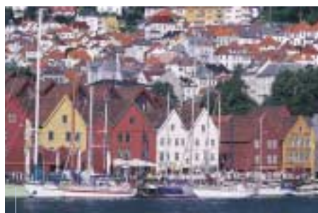
Les labels comme "Pavillon bleu" participent à une meilleure prise en compte de l'environnement.

Des "labels qualité" et des "assurances qualité". Il en existe beaucoup à travers l'Europe, mais ils ne fournissent pas de recommandations globales. Les "assurances qualité" régissent essentiellement l'hébergement et la restauration. Les "labels qualité" ne donnent que des directives très vagues à propos, notamment, de la consommation d'eau et d'énergie, de la gestion des déchets ou du respect de la couche d'ozone. Quelques "labels qualité" dignes de ce nom existent cependant. Par exemple, le label "Pavillon bleu" est présent et récompense 2 800 plages et ports de plaisances dans 23 pays européens. Ses exigences concernent trois critères : qualité de l'eau, éducation environnementale et gestion de l'environnement.