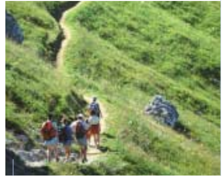
Les régions ont un rôle primordial à jouer dans le développement d'un tourisme respectueux de l'environnement et des populations locales.

En France, on manie cette notion avec plus de précautions. "En Alsace, nous n'avons pas de plan de développement de tourisme durable, explique Christian Fleith de l'Agence de développement touristique. Mais nous menons des actions très concrètes qui s'en rapprochent." L'Écomusée d'Ungersheim, où les 25 hectares de friches sont devenus un musée en plein air, fait partie de ces initiatives. À l'origine, cet "éco-parc" avait pour vocation la sauvegarde de l'architecture rurale, menacée de disparition. Puis l'activité s'est progressivement élargie.