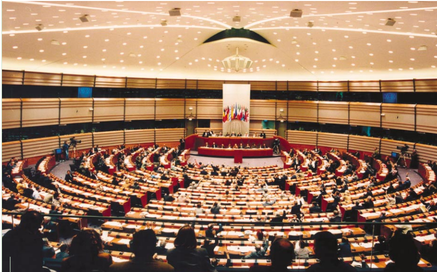
La CIG à pied d'œuvre pour entériner les travaux de la Convention

voire inespérées, l'équilibre obtenu reste précaire. Les domaines de la culture et de la santé sont toujours menacés par la politique libérale de la Commission européenne et potentiellement considérées comme de simples marchandises. Une réalité qui pèse très largement sur l'avenir de la diversité culturelle européenne, pourtant garante de succès et de d'émulation intellectuelle et organisationnelle.