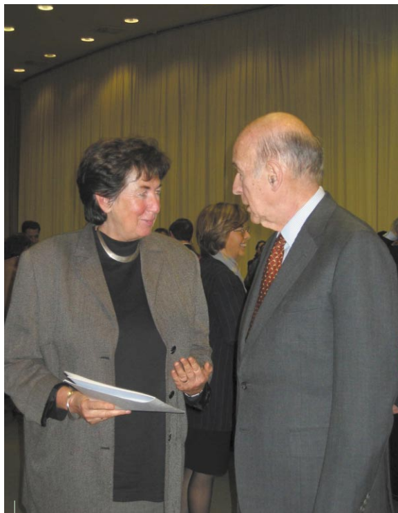
Mme Prokop remettant la contribution de l'ARE à la Convention européenne à Valéry Giscard d'Estaing

avec l'adoption de l'euro, ils auront posé les jalons d'une Europe du sens. Plus qu'un marché économique, l'Union devait désormais être politique. Se doter de règles claires et replacer (enfin) le citoyen au cœur du puzzle communautaire. La tortue à tête de dragon qui n'aura cessé d'accompagner le Président de la Convention, plus qu'un simple emblème, s'avéra être une alliée de taille : force et persévérance auront accompagné les conventionnels. Le message du projet constituant est fort. L'Union sera un espace de "pluralis-