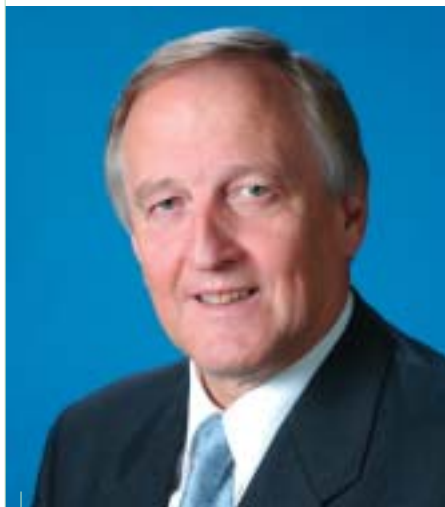
Peter Straub Przewodniczący Landu Baden-Württembergia i Przewodniczący Komisji do Spraw Instytucjonalnych Zgromadzenia Regionów Europy.

Czy to znaczy, że regiony mogą nawet zgłaszać zastrzeżenia do Komisji lub sprzeciwić się projektowi prawa?