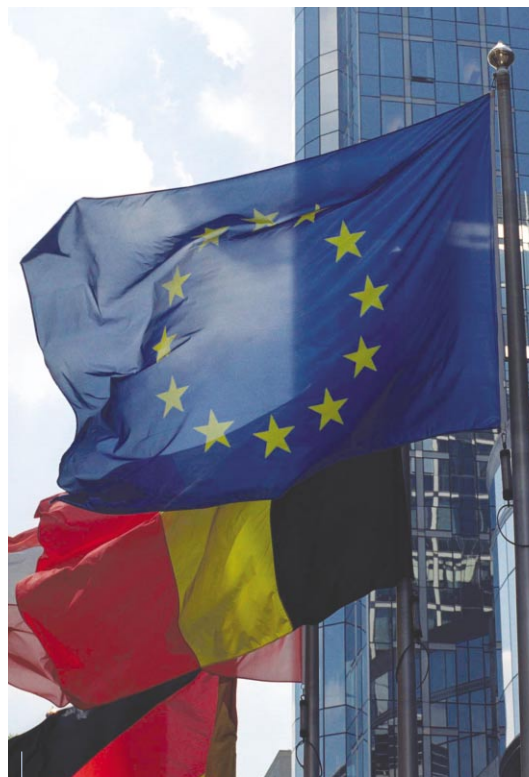
Die Fahne der Union schwebt jetzt über 25 Ländern

Politik an ihre Erwartungen, was wiederum eine Klärung der Zuständigkeiten zwischen den verschiedenen Entscheidungsebenen voraussetzt, werden entscheidend sein sowohl für die Zukunft