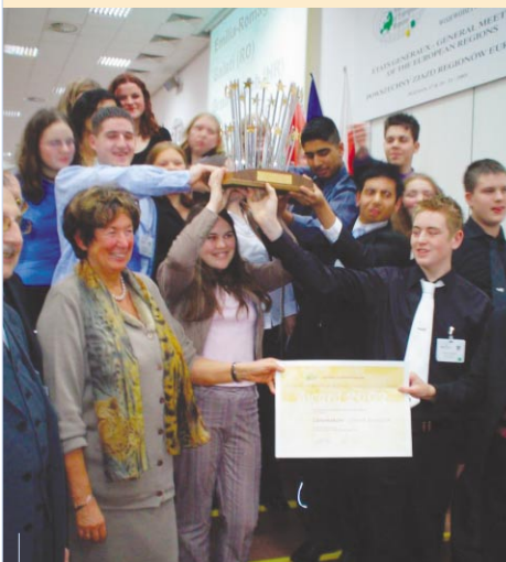
Die Jugendlichen aus Lancashire feiern ihren Erfolg

REDEN ALLEIN REICHT NICHT MEHR, MAHNT DIE JUGEND IMMER WIEDER. SIE WILL TATEN SEHEN, ÜBERZEUGT WERDEN. DIESER APPELL WURDE VON VIELEN REGIONEN EUROPAS GEHÖRT, DIE AM WETTBEWERB DER VRE FÜR DIE JUGENDFREUNDLICHSTE REGION TEILNAHMEN. DER GEWINNER: LANCASHIRE, WO DIE JUGEND DIE MACHT ERLERNT UND ERGREIFT.