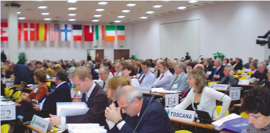
600 Personen traten in Posen anlässlich der Generalstände der Regionen Europas zusammen