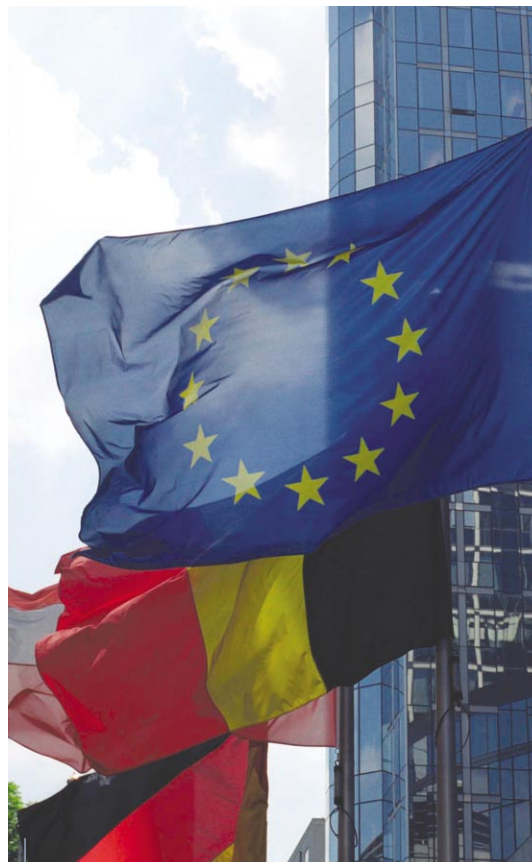
Le drapeau de l'Union flotte maintenant sur 25 pays

implique, à son tour, une clarification des compétences entre les divers niveaux de gouvernance seront déterminantes tant pour