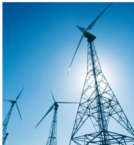
Les éoliennes, source d'énergie renouvelable, commencent à fleurir en Europe.

Politique fiscale en faveur des biocarburants en France ; projet d'investissement de 23,6 milliards d'euros sur cinq ans en faveur des énergies vertes en Espagne ; aides au développement de parcs éoliens et solaires en Allemagne ; plan d'urgence en cinq points pour la Commission européenne visant notamment à réduire la demande en énergie et à développer la recherche sur les énergies renouvelables ; demande du Parlement européen d'établir un instrument contraignant por-