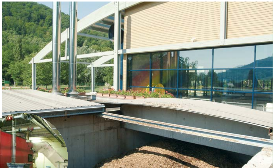
Les chaufferies au bois sont de plus en plus utilisées dans les établissements publics régionaux.

Tout l'enjeu est d'ailleurs là. Plus qu'une simple sortie de l'ère pétrolière, les mutations en cours n'ont d'égal que les précédentes révolutions industrielles ou l'émergence d'Internet. Trois événements majeurs qui ont profondément bouleversé nos schémas de pensée et nos modes de fonctionnement. Mais ces mutations ne se concentrent nullement autour de la seule pile à combustible et concernent l'ensemble des énergies renouvelables. Face à la fin du pétrole, note le Parlement européen, il s'agira d'envisager la question de l'énergie non plus comme centrée sur l'offre et dominée par une seule technologie, mais au moyen d'une approche systémique des politiques énergétiques basée sur trois piliers : l'intelligence énergétique (conservation et efficacité énergétiques), l'utilisation d'énergies à basse densité (collecteurs thermiques solaires, par exemple), et le rapprochement des sources de production de leur lieu d'utilisation,