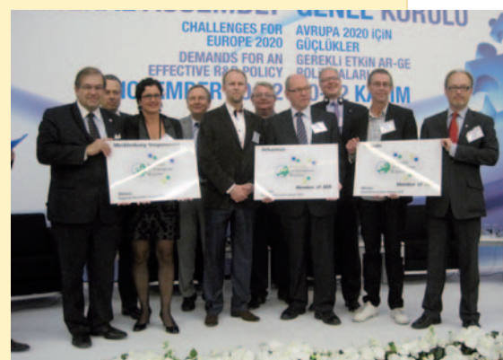
Die drei Gewinner des Innovationspreises der VRE 2010.

In der Kategorie Menschen fiel die Entscheidung der Jury zugunsten des Projekts „Demola“ der Region Tampere in Finnland. Die Regierung von Tampere hat ein lukratives Innovationsumfeld für Studenten und Unternehmen geschaffen: Hierbei entwerfen Studenten Vorstellungen von