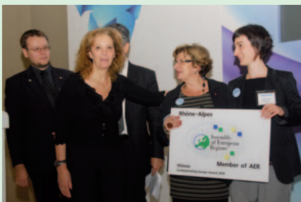
Die Gewinner des Kommunikationspreises der VRE 2010.

Die Jury zeichnete daneben die Region Vrancea (RO) mit einer besonderen Erwähnung für das Projekt „Deine Identität – eine Chance für gleiche Rechte“ aus. Vrancea untersuchte mit diesem Projekt Möglichkeiten, die Minderheit der Roma besser in die Gesellschaft zu integrieren. Viele Roma leben schon deshalb am Rande der Gesellschaft, weil sie keine Papiere oder Geburtsurkunden besitzen. Die Initiative zielte darauf, dieses Problem zu beheben: Im Zuge von Aktionen zur Bewusstseinsbildung erlangten mehr als 1000 Roma legalen Status. Indem das Projekt auf diese Problematik hinweist, ist es ein hervorragendes Beispiel dafür, wie man die Werte eines sozialen und integrativen Europa vermittelt.