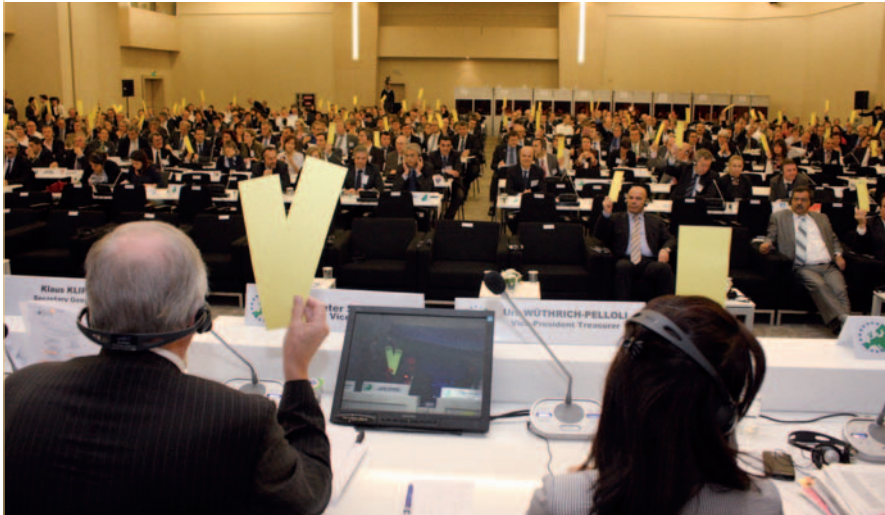
Mitglieder der VRE verabschieden einstimmig die Schlusserkklärung, Istanbul, 12. November.

DIE MITGLIEDER DER VRE FORDERN EINEN BOTTOM-UP-ANSATZ FÜR DIE BEWÄLTIGUNG DER GROSSEN HERAUSFORDERUNGEN, VOR DENEN EUROPA STEHT