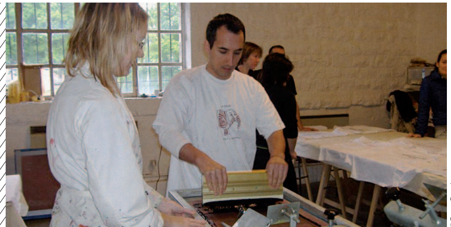
Junge „Eurodysséeer“ bei der Arbeit

Die EU wird sich zunehmend der Wichtigkeit der Ausbildung zu unternehmerischem Denken und Handeln bewusst