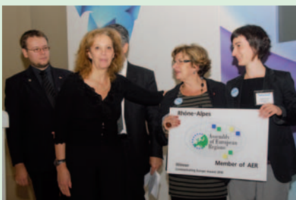
Les gagnants du Prix 'Communiquer l'Europe' de l'ARE 2010.

Le jury a également attribué une mention particulière à la région de Vrancea (RO) pour son projet « Votre identité – une chance pour l'égalité des droits ». Travaillant avec la communauté Rom, la Région de Vrancea examine des moyens d'augmenter leur inclusion et d'améliorer leur intégration à la société. Un grand nombre de citoyens Roms sont socialement exclus, en partie parce qu'ils n'ont ni papiers d'identité, ni certificat de naissance, un problème auquel cette initiative se propose de remédier. Plus de 1 000 citoyens Roms ont vu leur situation régularisée suite à des actions de sensibilisation. En ouvrant un tel débat, ce projet constitue un excellent exemple de communication des valeurs d'une Europe sociale et soucieuse de l'inclusion de tous ses citoyens.