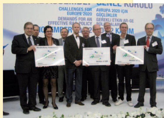
Les trois gagnants du Prix Innovation Régionale de l'ARE 2010.

Dans la catégorie 'Personnes', c'est le projet « Demola » de la région finlandaise de Tampere qui a le plus impressionné le jury. Le Conseil régional de Tampere a développé un environnement d'innovation lucrative pour les étudiants et entreprises,