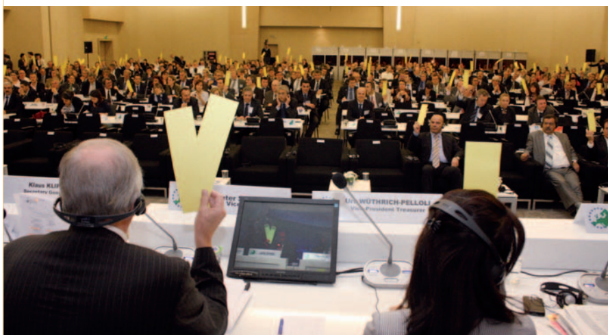
Les membres de l'ARE adoptent à l'unanimité leur déclaration finale, Istanbul, 12 novembre.

LES MEMBRES DE L'ARE EXIGENT QU'UNE APPROCHE ASCENDANTE SOIT ADOPTÉE POUR ABORDER LES PRINCIPAUX DÉFIS EUROPÉENS