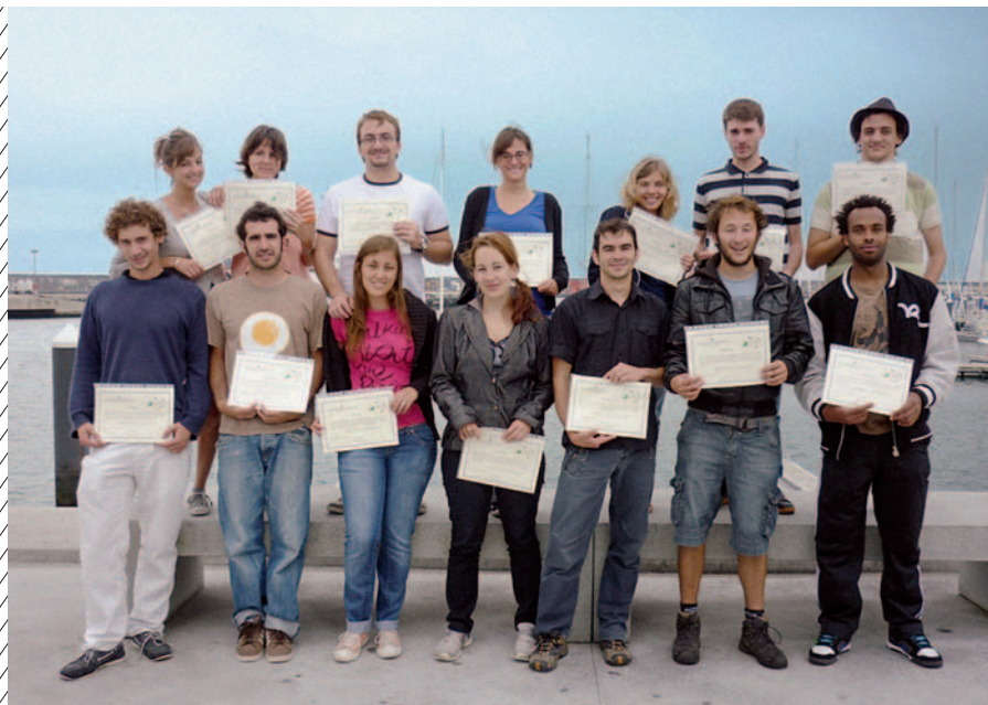
Remise des certificats Eurodyssée (Açores, juillet 2010)

Plus de 10 000 jeunes ont déjà bénéficié des opportunités offertes par Eurodyssée depuis son lancement il y a de cela 25 ans.