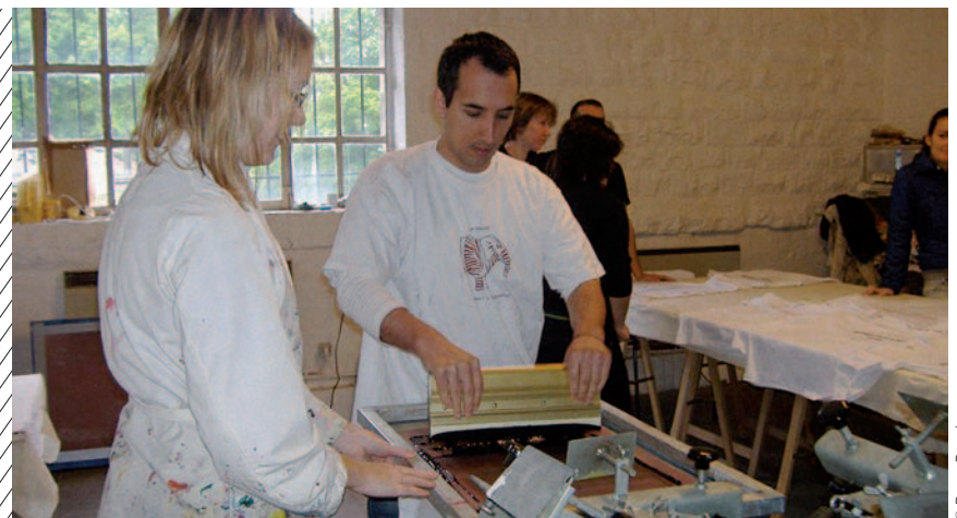
Jeunes « Eurodysséens » au travail

L'UE est de plus en plus consciente de l'importance de la formation à l'entrepreneuriat