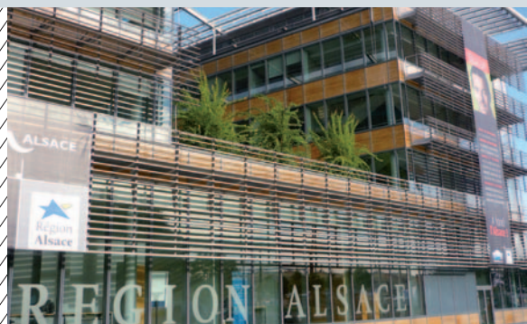
© Atelier d'Architecture Chaix et Morel et Associés

L. Merabet affirme que la région est « inquiète » quant à la situation de ses jeunes. En effet, ceux-ci ne jouissent d'autonomie qu'à l'âge de 28 ans, alors qu'ils sont légalement responsables depuis déjà 10 ans. « Les jeunes sont menacés, en particulier sur le plan économique », a-t-elle mis en garde.