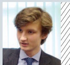
Stellvertretender Präsident Michal Matlak Zachodniopomorskie (PL)