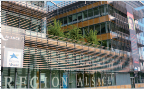
© Atelier d'Architecture Chaix et Morel et Associés

Merabet meinte, die Region sei besorgt über die Lage ihrer Jugendlichen, die oft noch mit 28 Jahren, d. h. zehn Jahre nach Erreichen der Volljährigkeit, keine wirtschaftliche Unabhängigkeit genossen. „Junge Menschen sind besonders in wirtschaftlicher Hinsicht gefährdet“, warnte sie.