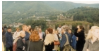
Découverte de Ticino par les participants au Forum Eurodyssée 2001

Eurodyssée, qui réunit actuellement 27 régions partenaires 1) , est le premier programme créé par l'ARE, en 1985, et dont elle est particulièrement fière.