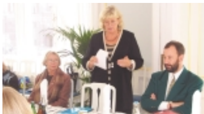
Déjeuner-débat à l'invitation de Margareta Winberg, Ministre suédoise chargée de la parité hommes-femmes